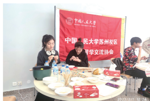
春节期间，由中法学院赴法留学生代表组成的留学交流协会同学在马赛包饺子，向外国同学讲解饺子的历史和寓意，让他们亲动手包饺子，感受中国春节的独特氛围。

在包饺子的过程中，负责准备的同学提前揉好面、调制馅料，包饺子的同学互相分享彼此国度的文化与历史，在不知不觉中，我们做到了双向交互，也扮演了文化传播的角色。饺子的很多同学也是第一次尝试自己包饺子，之前那些被忽略的年味就这样在异国他乡亲身体会到了个中乐趣。调制馅料的同学自豪地在镜头前说出自己的秘方，包饺子的同学手指翻飞将面皮捏出花样。我们将自己动手制作的饺子放入水中，看它们在沸水中翻滚，那一刻彼此的心意都得到了互通，共同品尝、共同分享、围坐一起探讨见闻与乐趣，另一种意义上的缘聚得到了体现。无论是对于外国友人，还是第一次亲自完成整个流程的中国学生来说，都有着意义非凡的体验。