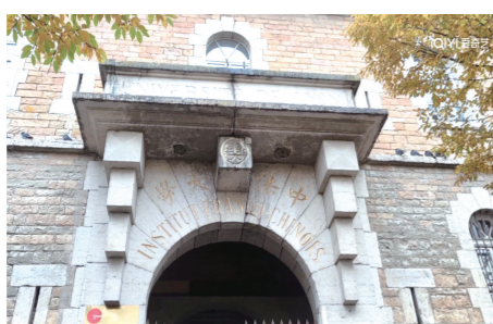
在法期间，中法学院学生赴里昂中法大学探寻百年前革命先辈足迹，更深刻了解传承勤工俭学的精神。

不像南法终日直白火热的阳光，里昂的天气似乎更加含蓄低沉，走出车站撞见的是阴沉的天空和阵阵的秋风。简单整顿休息后，我们从车站步行前往里昂中法大学。里昂中法大学是中国近代在海外设立的唯一一所大学类机构，也是近代中法最早的合作办学形式。她的历史，是轰轰烈烈的中国留法勤工俭学运动史的重要组成部分，作为赴法求学的青年，作为人民大学中法学院的学子，里昂中法大学与我们的渊源不可谓不深。为了探寻百年前革命先辈奋斗的地方，为了更深刻了解传承勤